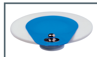
S = bouton pression