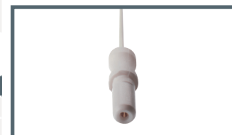
K = 1,5 mm connector