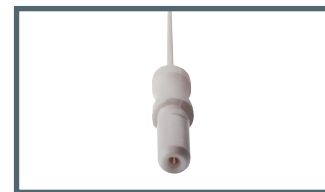
K = 1,5 mm connector