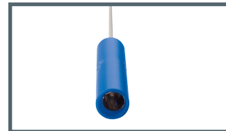
A = 4 mm connector