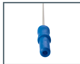
J = 2 mm connecteur