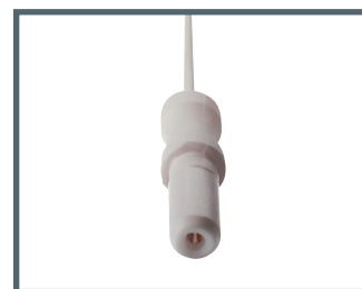
K = 1.5 mm connecteur