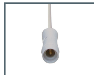
SC = 0.7 mm connecteur