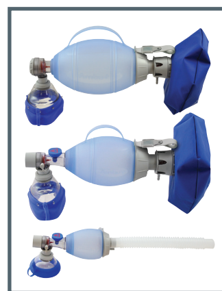
Masque Transparent sans Latex Ambu connecté à un insufflateur Ambu Silicone Oval Plus